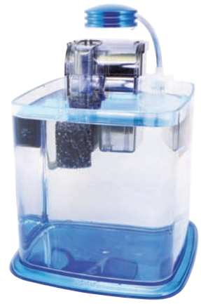
AZ33190 藍色 110V