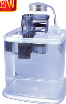
AZ33189 銀色 110V