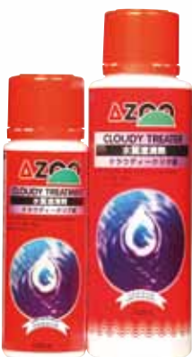
AZ17029 120 ml AZ17023 250 ml