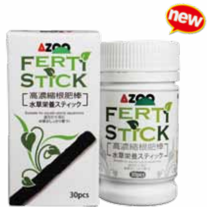
AZ18009 30 根 / 罐