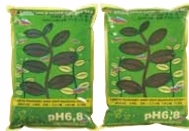
AZ11042 灰色 5.4 kg AZ11043 褐色 5.4 kg