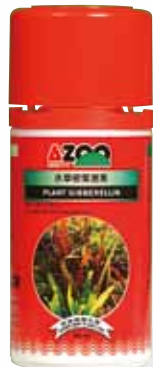
AZ11011 60 ml