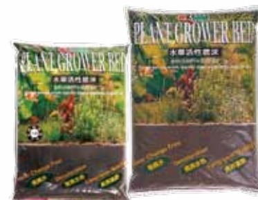
AZ11033 1.8kg AZ11026 5.4kg AZ11041 5.4kg 黑色