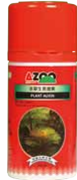
AZ11009 60 ml