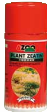
AZ11010 60 ml