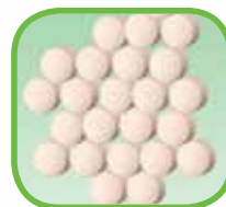
AZ17187 30 錠