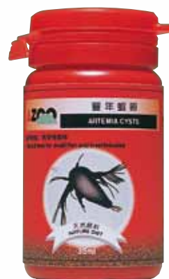
AZ80147 15 g / 35 ml