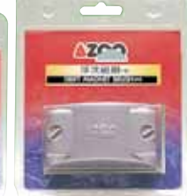
AZ16048 S AZ16049 M